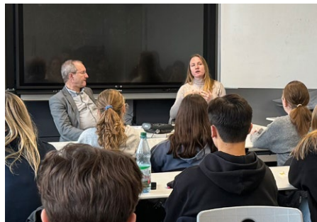
Kaiserin-Friedrich-Gymnasium Bad Homburg

Das John McCloy Transatlantic Forum macht es sich zur Aufgabe, das Nachdenken über Demokratie als Regierungs- und als Lebensform in die Gesellschaft zu tragen. Mit diesem Engagement wollen wir unterschiedliche Zielgruppen ansprechen. Deshalb bauen wir Kontakte zu Schulen in der Region auf, um auch mit Schülerinnen