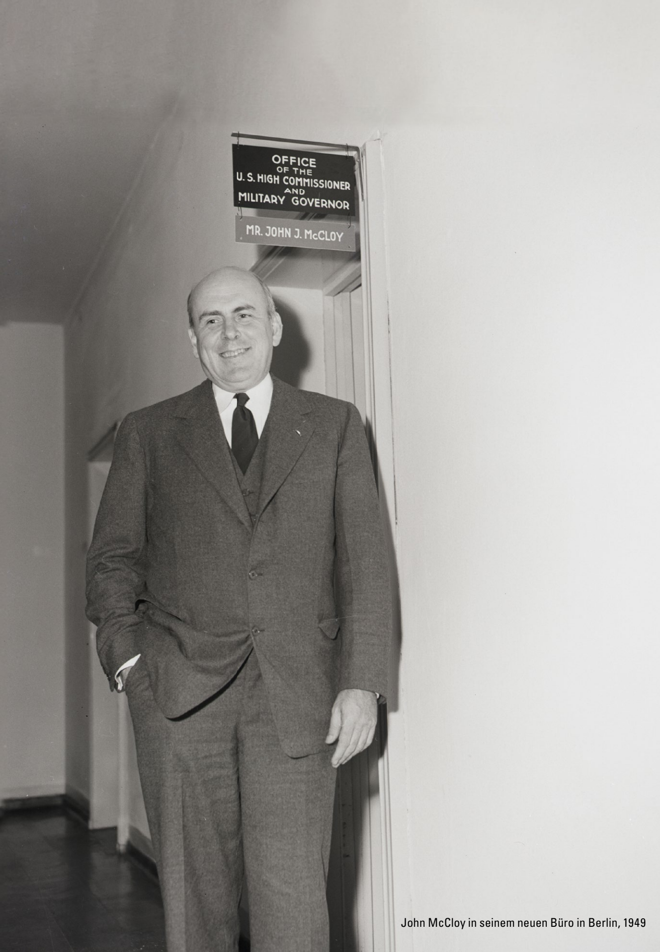
John McCloy in seinem neuen Büro in Berlin, 1949